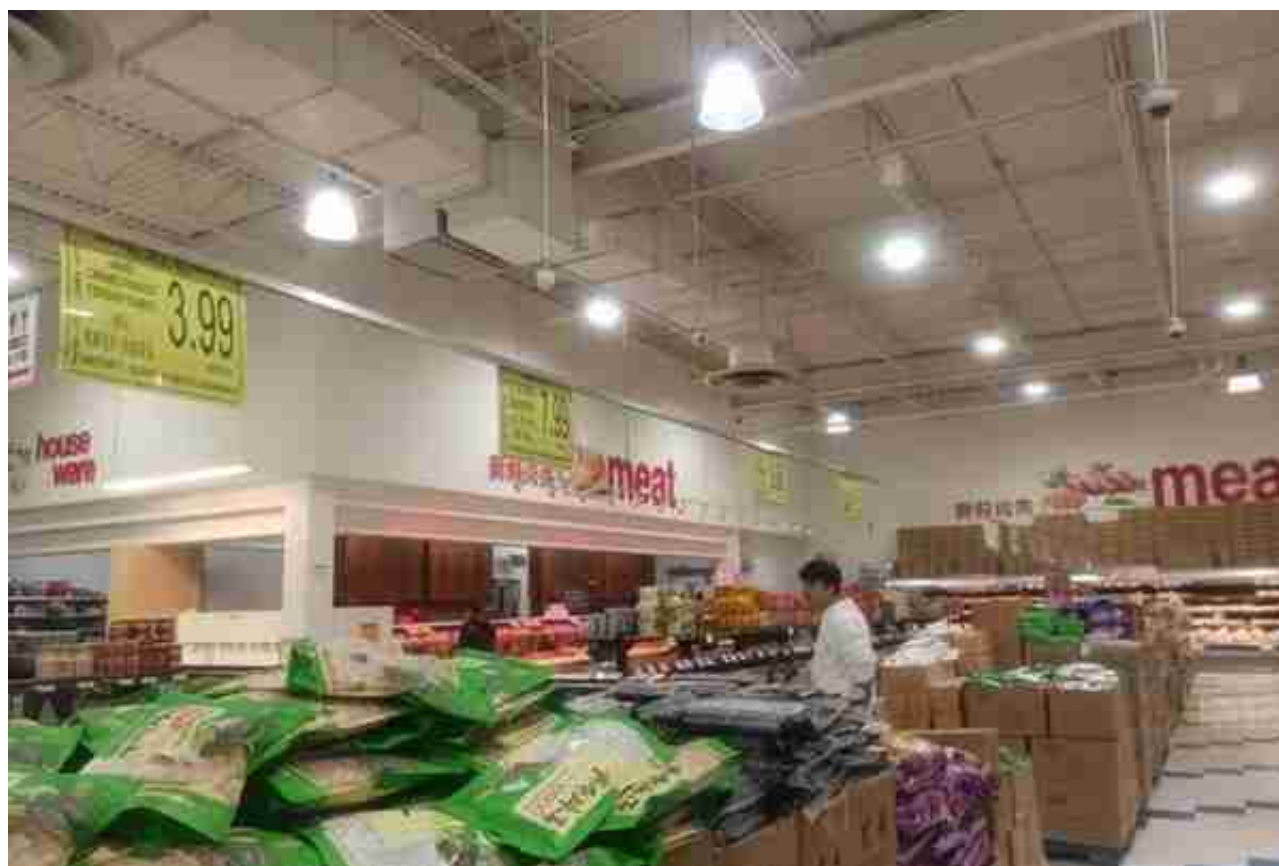
超市示意图 图文无关