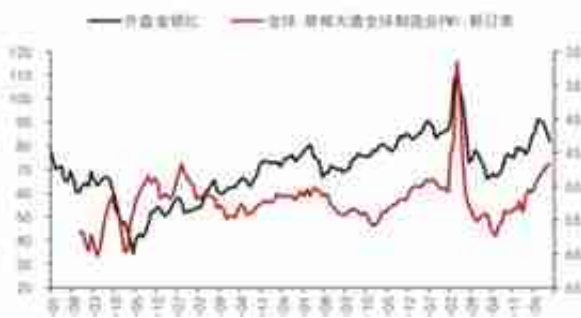
图3: 金银比与全球PMI (右轴, 逆序)